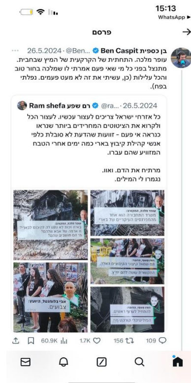
(הציוץ של מר שפע – מאות אלפי צפיות, הציוץ של מר בן כספית – למעלה מ- 60 אלף צפיות).